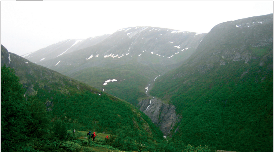
Speiderne vandrer over Vårstigen